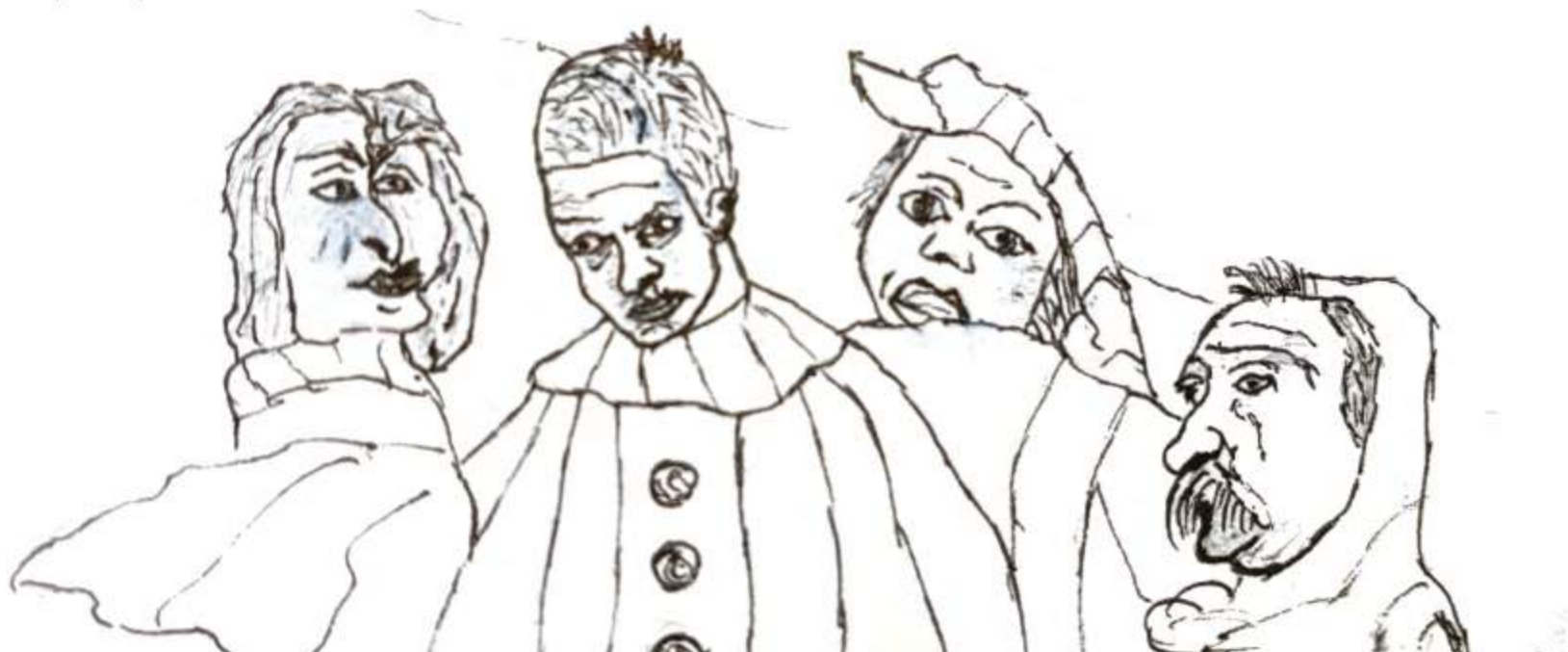
Dessin réalisé par une amie de l'auteur du témoignage