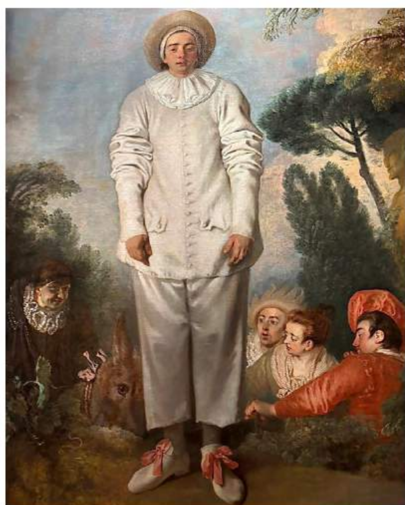
Photo prise par l'auteur du témoignage en 2025 au musée du Louvre

La violence subie se répète en amplifiant son pouvoir destructeur par l'inversion des valeurs.